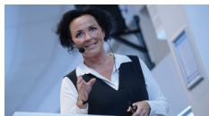
Bilder frå Stordkonferansen 2018