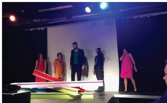
Festkomiteen opnar årsfesten – koreografi av Magdalena From Delis