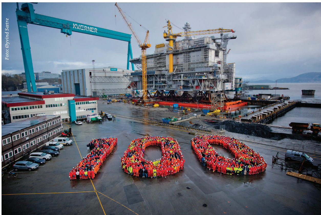
Alle tilsette ved Kværner på Stord markerer at selskapet er 100 år i 2019

Parallelt med desse prosjekta har det vore stor aktivitet på kaiprojektet. Ein stor del av utdjuingsjobben blei gjort i løpet av året, slik at det i 2019 er klart for bygginga av kaifundamenta.