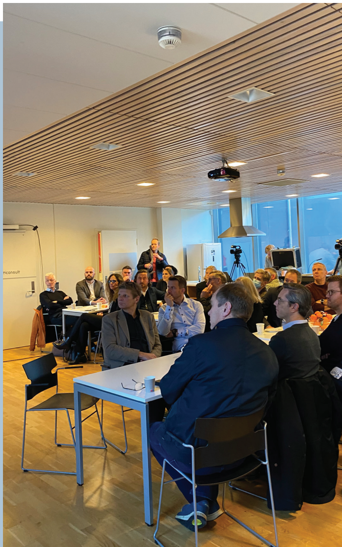
Godt oppmøte på lansering av Grøn Region Sunnhordland