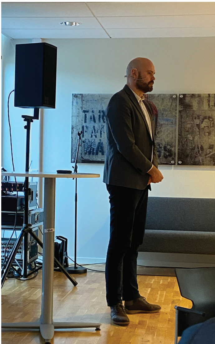
Ordforar Gaute Epland - Stord kommune