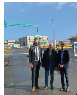
Omvisning på Katapultsenteret og fotoseanse foran Aker Solutions på Eldoyane.