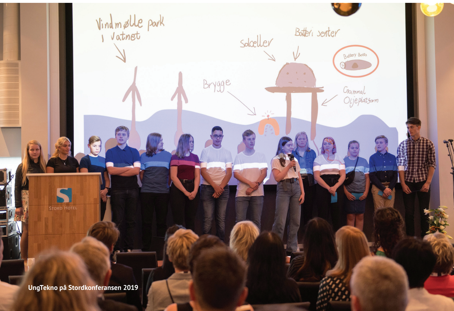
UngTekno på Stordkonferansen 2019