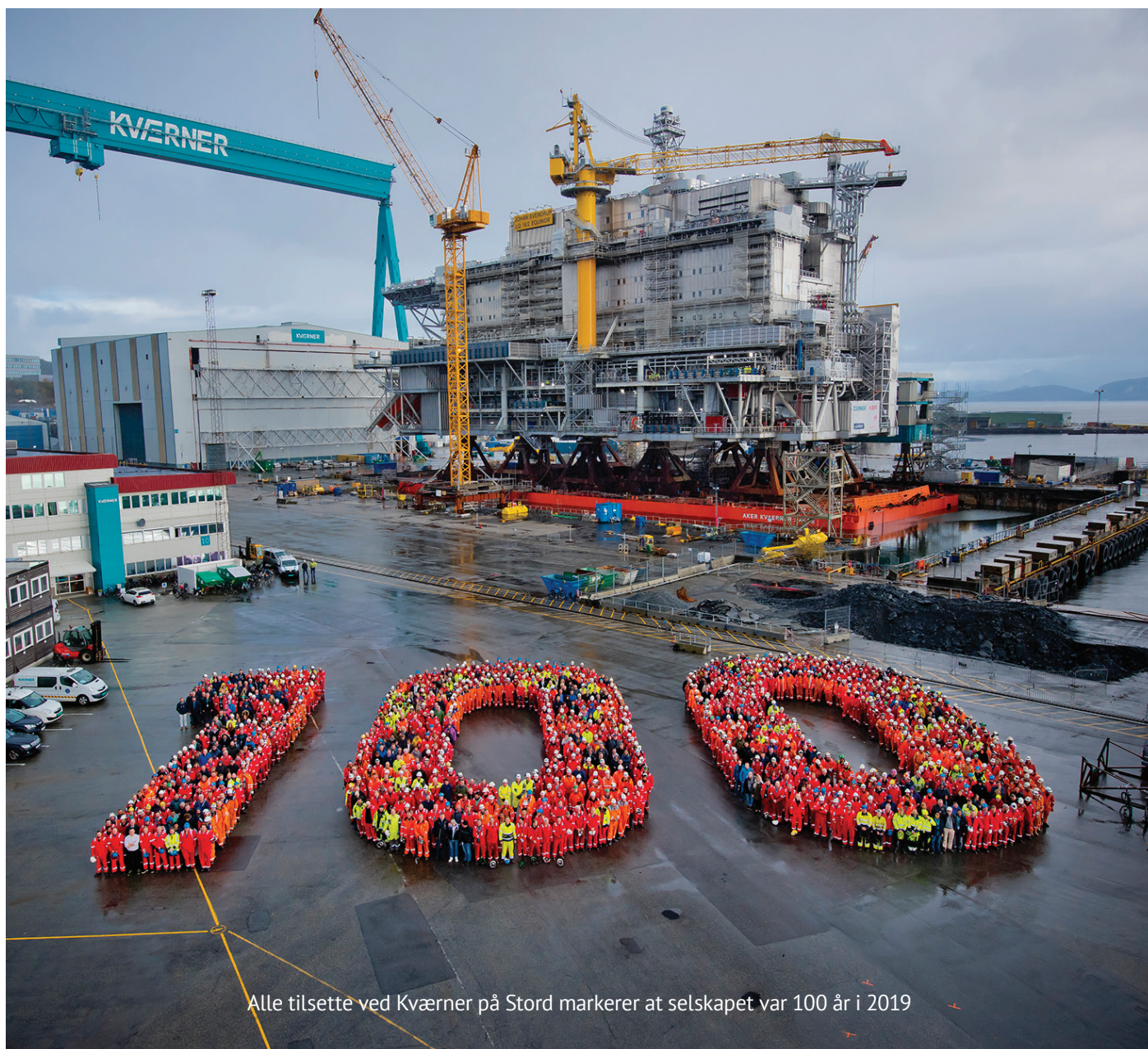
Alle tilsette ved Kvaerner på Stord markerer at selskapet var 100 år i 2019